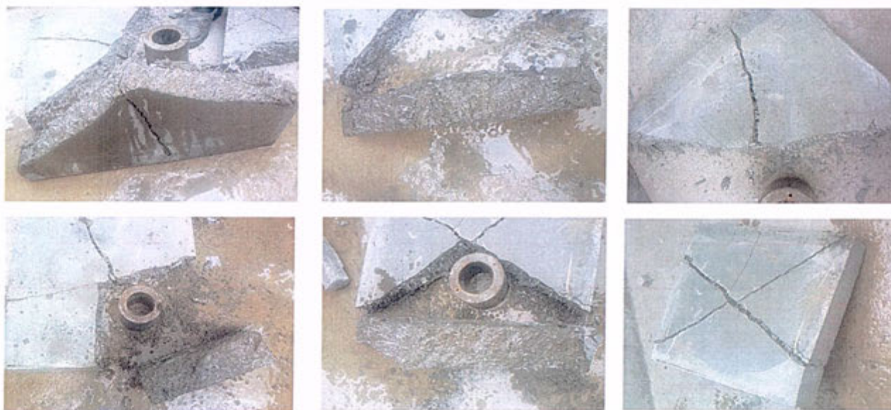
Fotos 1 a 6 - Após realização do ensaio